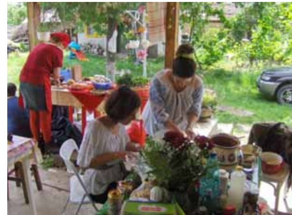
Concurs anual de gatit