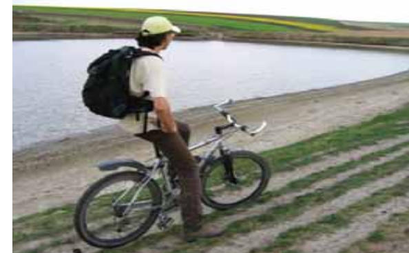
Cu bicla prin imprejurimi